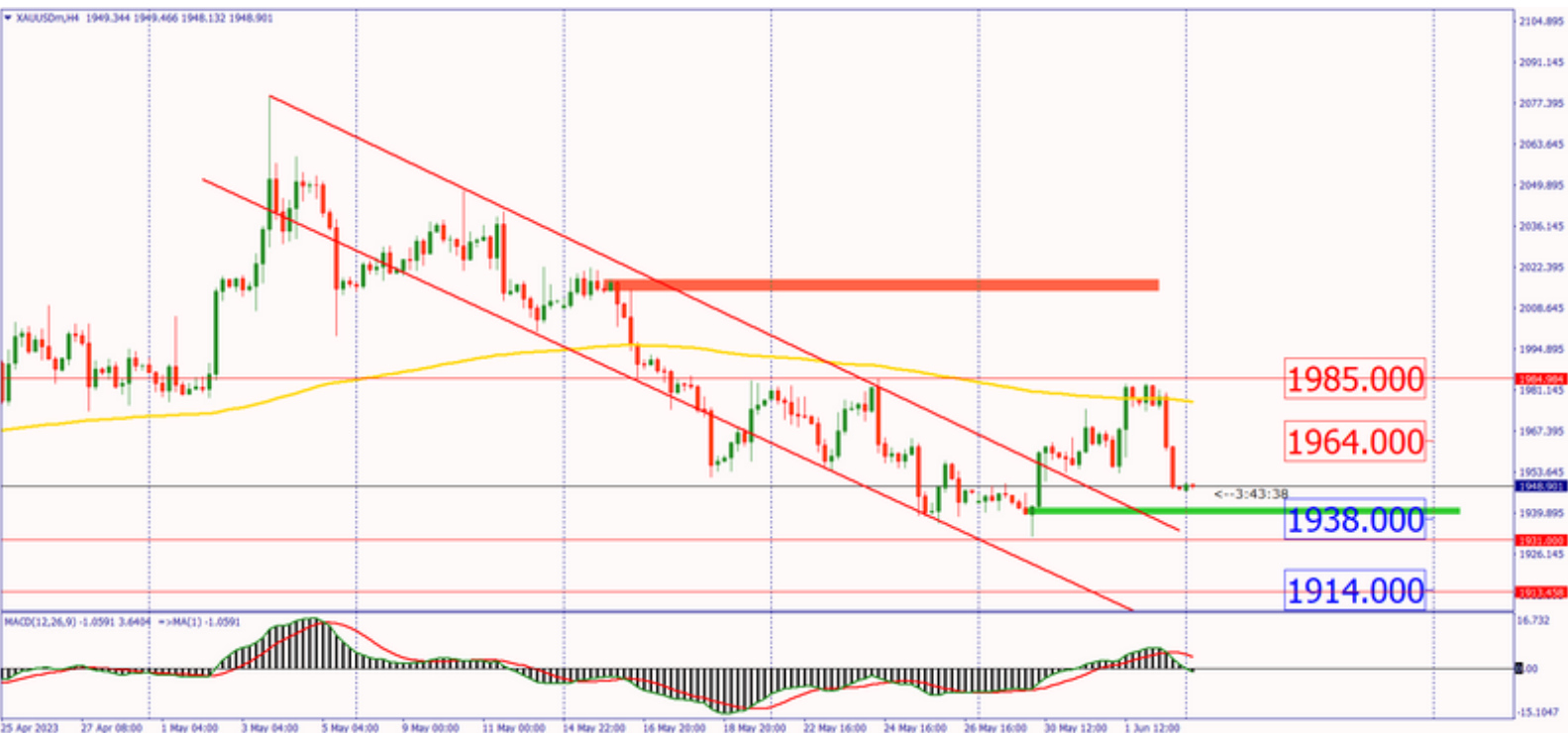
กราฟทองคำ Gold Spot ราย H4

ชะลอการเข้าสถานะ และ 1914$ เป็นแนวรับสุดท้ายของวันนี้